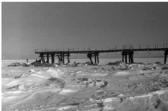
Stare świnoujskie moło tego roku, częściowo zniszczone pod naporem lodu.